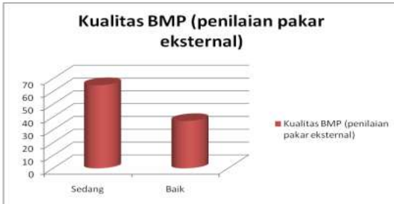
Tabel 2. Kualitas BMP Keseluruhan Penilaian Pakar

eksternal. Dan keempat , memanfaatkan basis data tersebut di atas tidak saja untuk kegiatan-kegiatan revidi tetapi juga kegiatan penulisan BMP dan pengembangan produk akademik lainnya yang diperlukan UT.